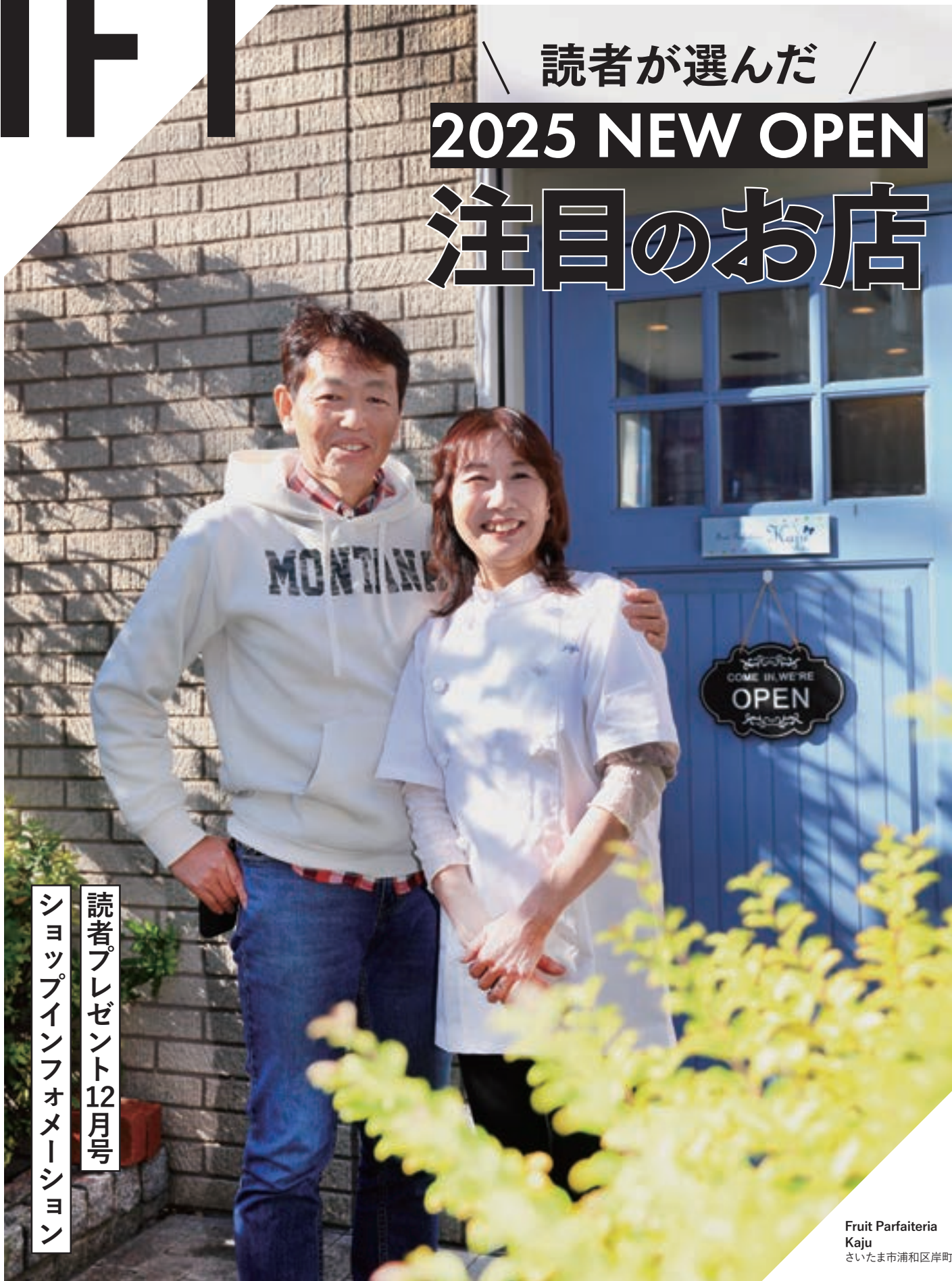
Fruit Parfaiteria Kaju さいたま市浦和区岸町